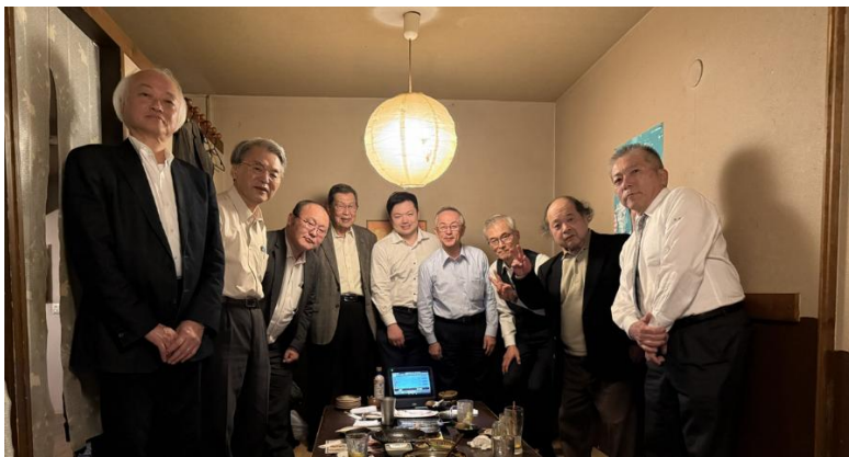
懇親会 2 次会