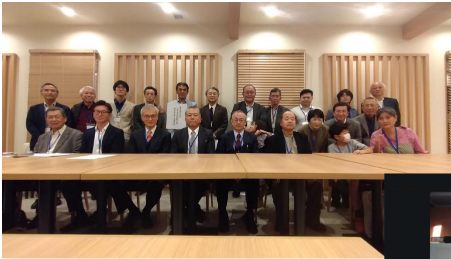
現地参加者全体写真