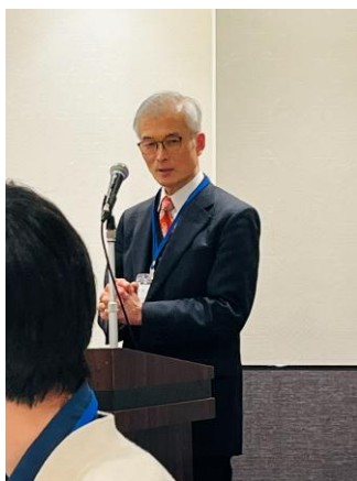
竹田首都圏総支部長