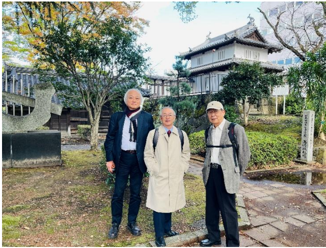
オプションツアー①