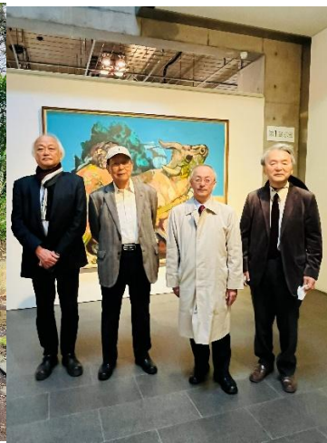
オプションツアー②