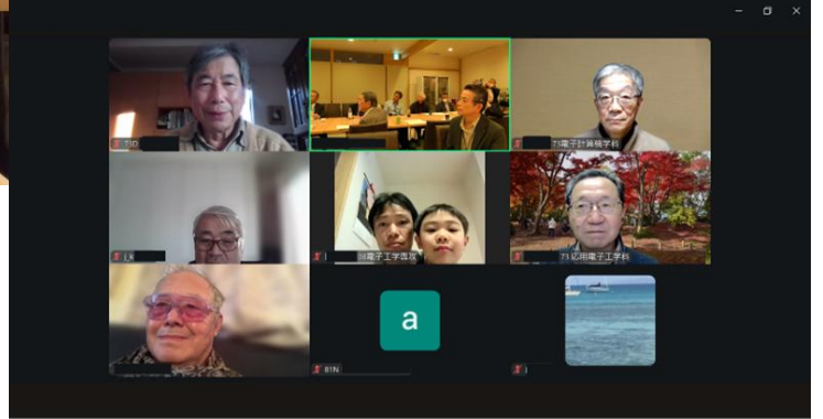
オンライン参加の皆様