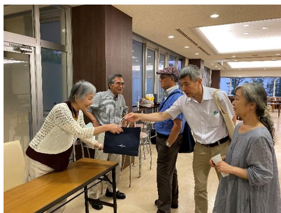
散会時の受付風景