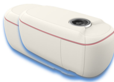
乳房用超音波画像診断装置外観