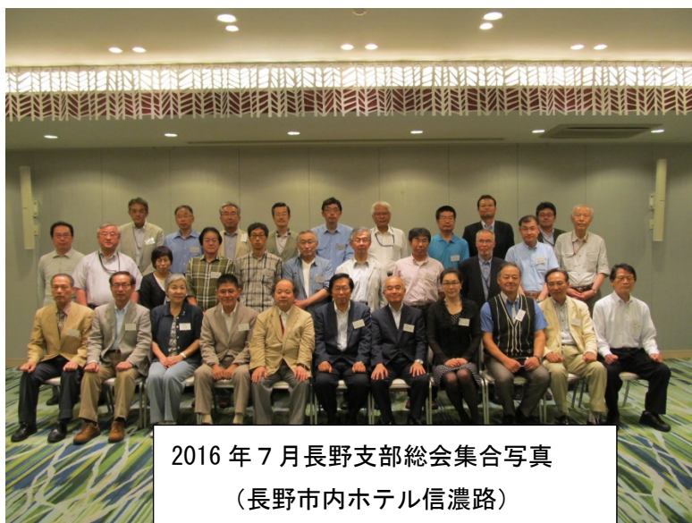
2016年7月長野支部総会集合写真 (長野市内ホテル信濃路)